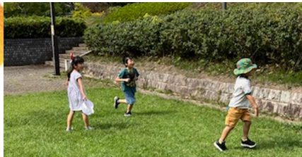
戸頭公園で虫取り