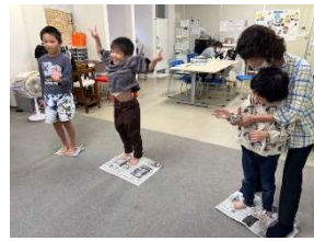
新聞紙じゃんけん