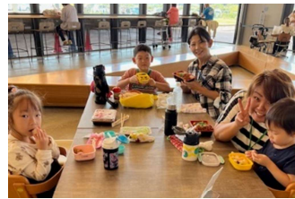
しょうなん道の駅